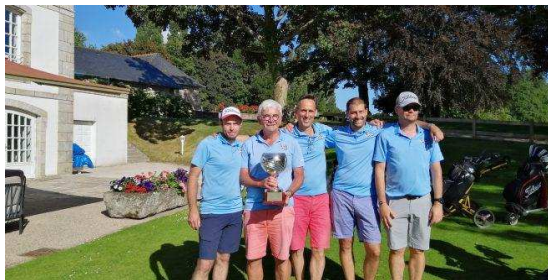
Les vainqueurs 2022 (Les cheminots Rennais)

Elle a pour but de sélectionner les 2 AS qui représenteront la Bretagne lors de la finale nationale, qui se déroulera du 08 au 10 septembre, sur le golf de Montpensier (03).