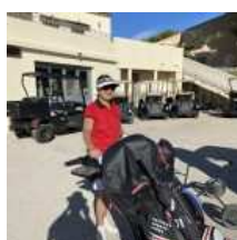
L'équipe de Bretagne 2022